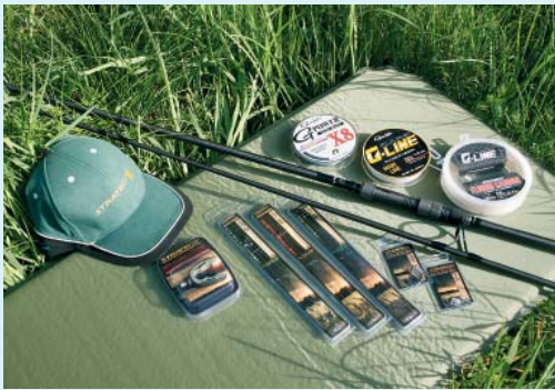
Ein paar interessante Neuheiten aus dem aktuellen Programm.