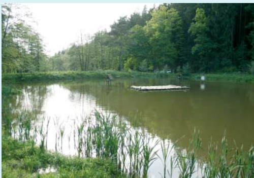
Eine wirkliche Augenweide: Die Teiche der Firma SPRO.