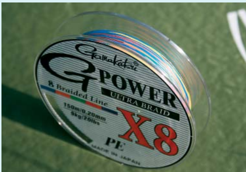
Sieht bunt aus, hilft aber beim Wiederfinden des Spots: Mehrfarbige geflochtene Schnur.